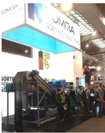
TOMRA FPS Sortierer / Sorter

Die robuste Maschine bietet Erzeugern und Verpackungsbetrieben hohe Kapazitäten sowie Produktionsleistungen, gleich ob vor der Einlagerung oder danach zur Weiterverarbeitung