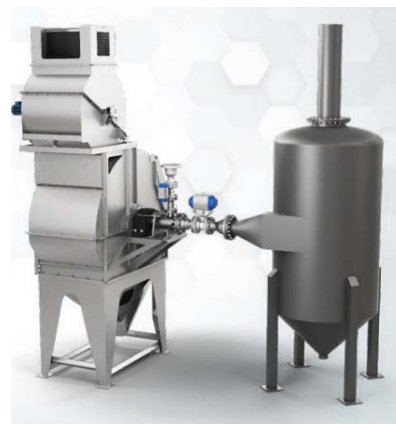
TOMRA Steam Peeler

Mit unserem Partner TOMRA konnten wir die neueste optische Sortiertechnologie für ganze und geschnittene Kartoffeln und anderes Gemüse sowie unsere Dampfschäl-Lösungen präsentieren.